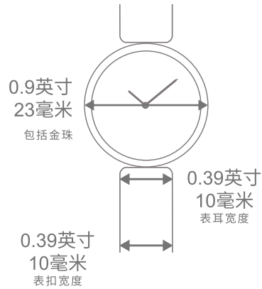
Perlée腕表, 23毫米 金质表链