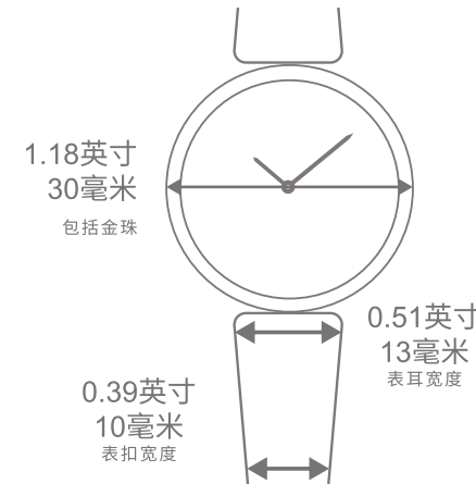
Perlée腕表, 30毫米 皮革表带