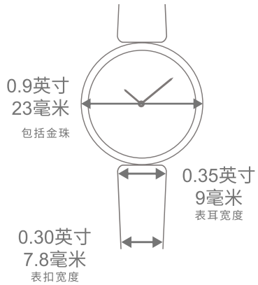
Perlée腕表, 23毫米 皮革表带